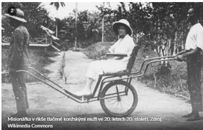
Misionářka v rikše tlačené konžskými muži ve 20. letech 20. století.

Misionářka tlačena v rikše konžskými muži, 20. léta 20. století.