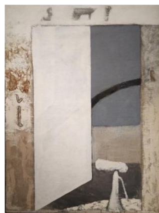
Otvírající se dveře, 1977–1978, olej, plátno