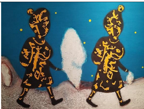
Sestry (dvě poutnice), 2020, kombinovaná technika, plátno