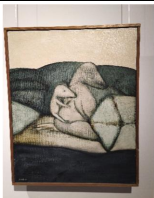
Mládě, 1983, olej, plátno