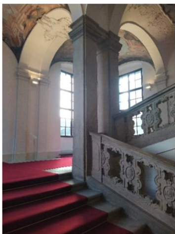
Vstup do Clam-Gallasova paláce navozuje pocit vznešenosti.