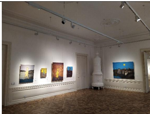
Pohled do jednoho ze sálů Clam-Gallasova paláce.