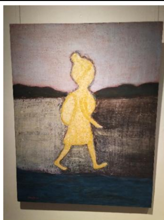
Poutnice v jižních Čechách, 2020, akryl/olej, plátno na dřevě