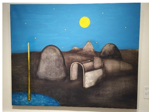
Úkryt poutnice, 2024, akryl, kombinovaná technika